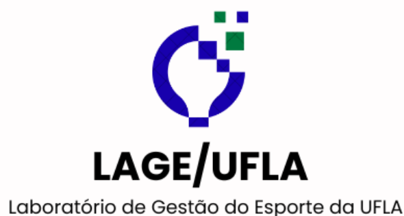
Figura 4 – Logotipo do LAGE/UFLA

O LAGE/UFLA já nasce com um propósito muito claro que é realizar pesquisas e estudos em gestão do esporte que possam contribuir para o ecossistema esportivo glocal (globalizado e local). Com isso, o grupo possui como base a realização de pesquisas básicas orientadas e pesquisas aplicadas (Stokes, 2005) que possam gerar produtos relevantes para a sociedade. Todas as pesquisas do laboratório serão direcionadas a essa geração de produtos, e juntamente a isso propostas de problemas de pesquisas que possam solucionar problemas reais do ecossistema esportivo. Como resultados se espera contribuir para a gestão de organizações esportivas em diversos níveis, e gerar produtos inovadores que possam auxiliar essas entidades. Esse propósito foi levado para o logotipo do laboratório entendendo a importância que esse símbolo possui para a marca do LAGE/UFLA (Figura 4).