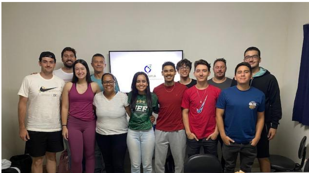
Figura 5 – Foto da primeira reunião do LAGE/UFLA

Pensando sempre em pesquisas básicas orientadas e pesquisas aplicadas, com geração de produtos inovadores para solucionar problemas reais do ecossistema esportivo, o LAGE/UFLA propõe realizar parcerias com diversos stakeholders , como por exemplo grupos e laboratórios de pesquisa em gestão do esporte, e entidades públicas e privadas de Lavras. Essas parcerias serão fundamentais para que o grupo possa contribuir para o setor.