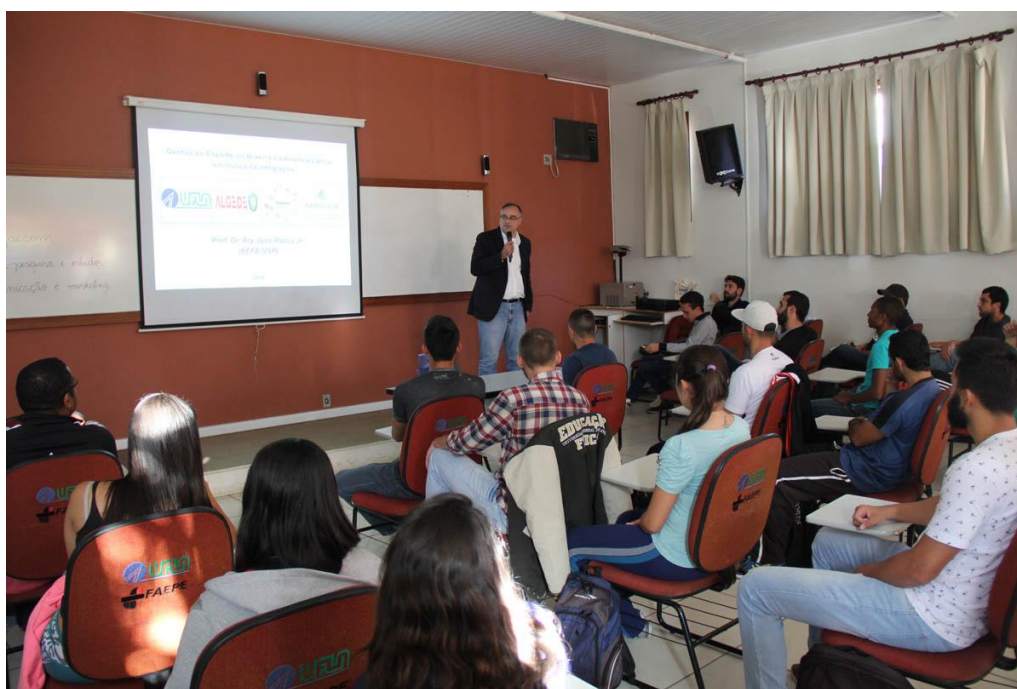
Figura 2 – Palestra Inaugural do professor Ary Rocco no GEPECOM/UFLA em 2016

Então, no dia 17 de junho de 2016 a UFLA teve a abertura do GEPECOM/UFLA com a presença do prof Ary Rocco Júnior da USP. Nesse momento o professor trouxe um panorama da gestão do esporte no Brasil e América Latina, elencando possíveis caminhos para as pesquisas na área. Ali se iniciava o movimento do grupo de pesquisa na área da gestão do esporte. As figuras 2 e 3 mostram essa primeira reunião do grupo.